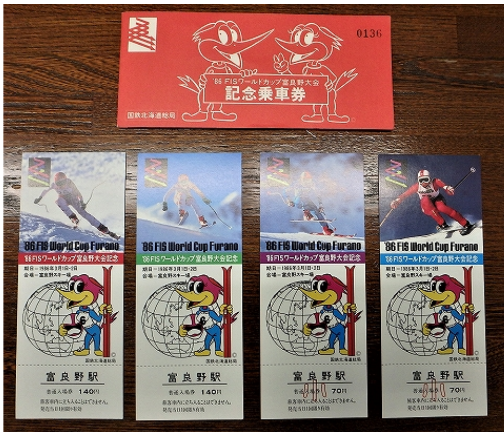
生活2185「国鉄の大会記念チケット」