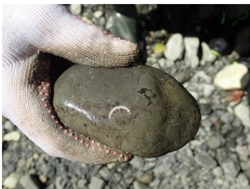
サンゴの化石も見つかりました(右)